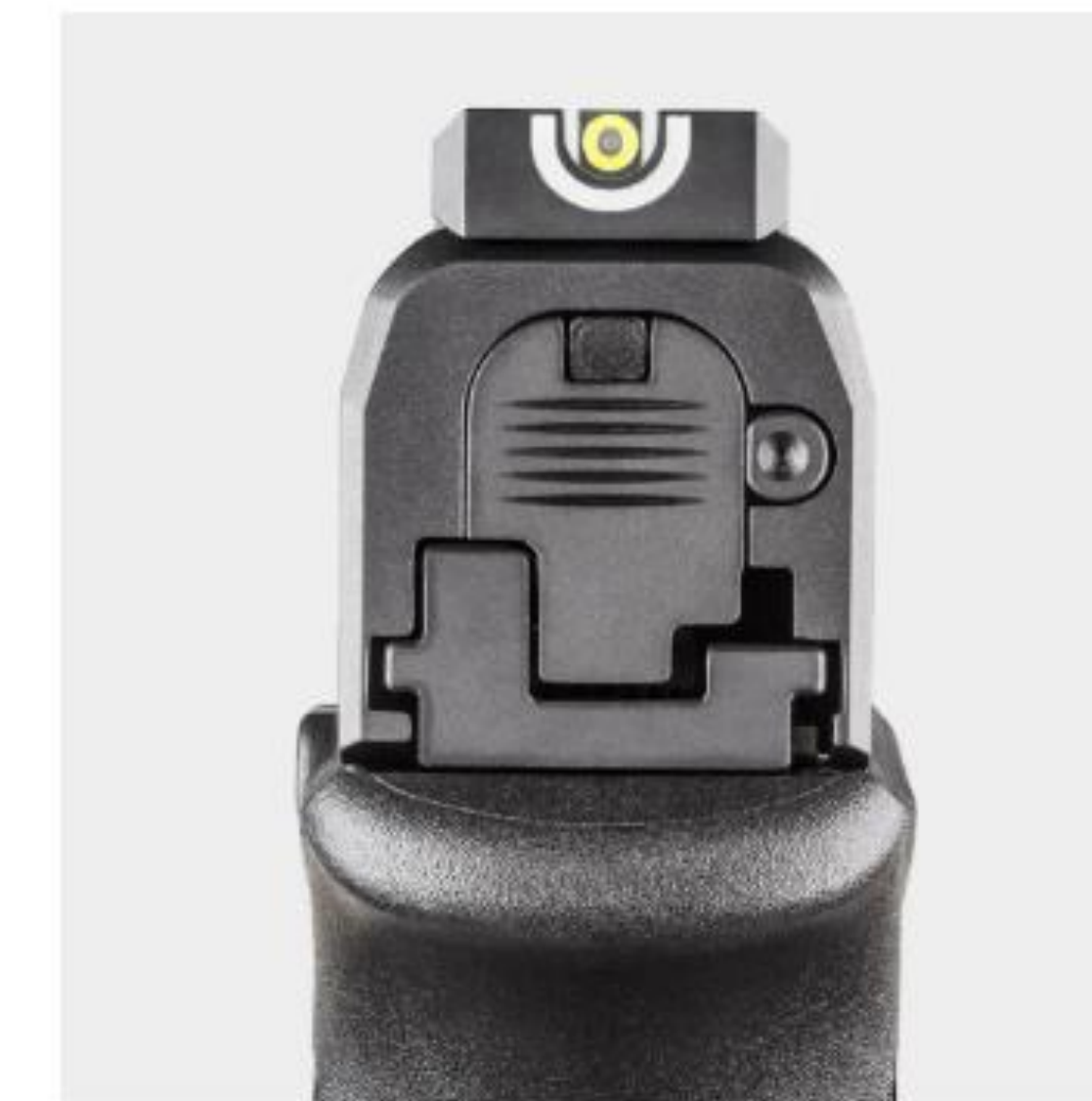
IMAGEN DE VISTA DE PUNTO U DE TRITIO

La textura de agarre adaptativo del Hellcat® forma un vínculo más fuerte cuanto más fuerte lo agarras.